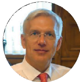
01. Кришьянис Кариньш. Премьер-министр

Д ля дипломатических отношений между Латвией и Испанией 2021 год стал особым в связи с празднованием столетнего юбилея установления дипломатических отношений. Испания направила в прибалтийские республики два контингента вооруженных сил, и наибольший из них — в Латвию. На базе Адажи (к северу от Риги) находятся 350 военнослужащих, которые участвуют в программе расширенного передового присутствия НАТО (eFP). После визита Педро Санчеса, который состоялся в июле этого года, обе страны стремятся к расширению и укреплению торговых и культурных связей, а также к углублению взаимопонимания.