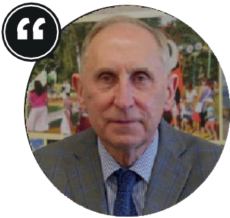
07. Янис Витолиньш. Мэр Вентспилса

Латвийский морской курорт с населением 36 000 человек является вторым по величине портом в Латвии после Риги. В 2019 году порт Вентспилса обработал 33%