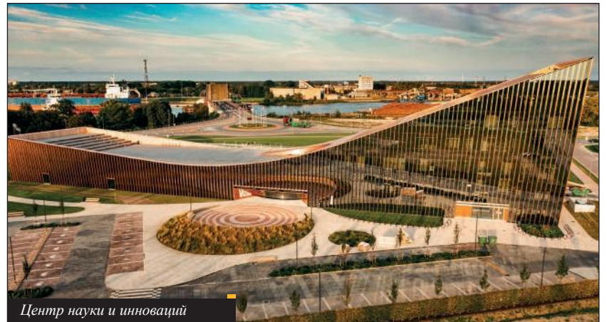
Центр науки и инноваций

Летом, когда в город приезжают местные и иностранные туристы, каждый из которых в среднем проводит здесь 3 ночи, население Вентспилса увеличивается до 220 000 человек. «Это свидетельствует о том, что наше предложение является достаточно привлекательным. Мы предлагаем отличные условия для отдыха семьям с детьми. В Вентспилсе есть два парка развлечений: один для активного отдыха, а второй с аттракционами. Ежегодно эти парки посещает более трехсот тысяч человек.