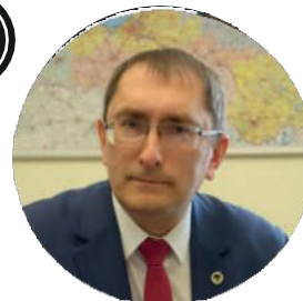
02. Талис Линкайтс. Министр транспорта