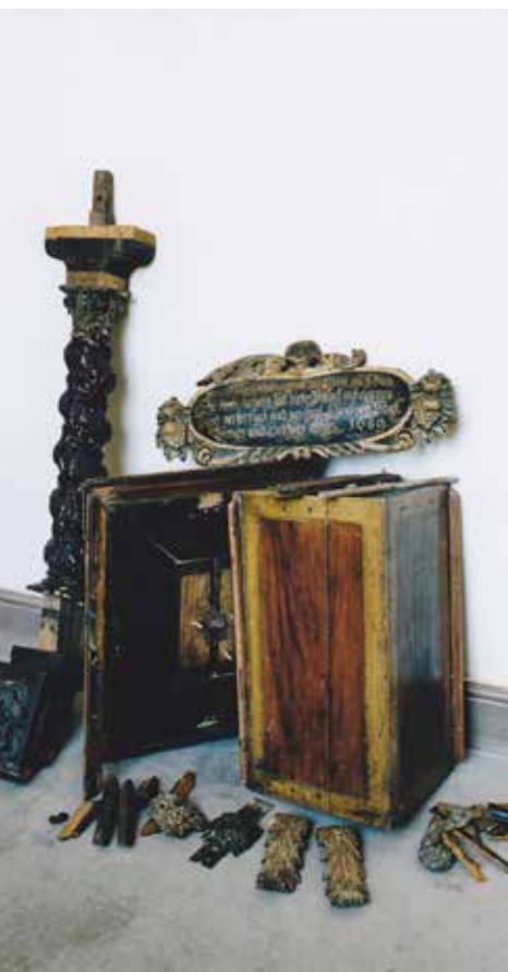
Bauskas Sv. Gara baznīca – lasāmpulsts restaurācija. Senākā saglabājusies celtnie Bauskas vecpilsētas daļā. Baznīcā saglabājusies vēsturiskā interjera elementi no 16.-18. gs.