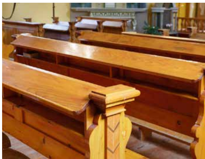
Feimaņu katoļu baznīca (Rēzeknes novads) – vēsturisko koka solu restaurācija. Pašreizējo koka baznīcu vecā dievnama vietā uzcēla 1756. gadā. Baznīcas interjers slavens ar lustrām, kokgriezumiem rotātiem altāriem, koka skulptūrām u.c. Daži kādreizējie Feimaņu baznīcas mākslas priekšmeti ir pārvietoti un glabājas Rundāles pilī un Ermitāžā.