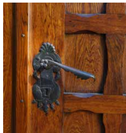
Rīgas Svētā Jāņa Eņģēliski luteriskā baznīca ir vecākais Latvijas Eņģēliski luteriskās Baznīcas dievnams Rīgā, kas latviešu draudzei pieder jau kopš 1582. gada. Esam atbalstījuši dažādus šīs baznīcas projektus, šajā gadījumā ieejas durvju restaurāciju.