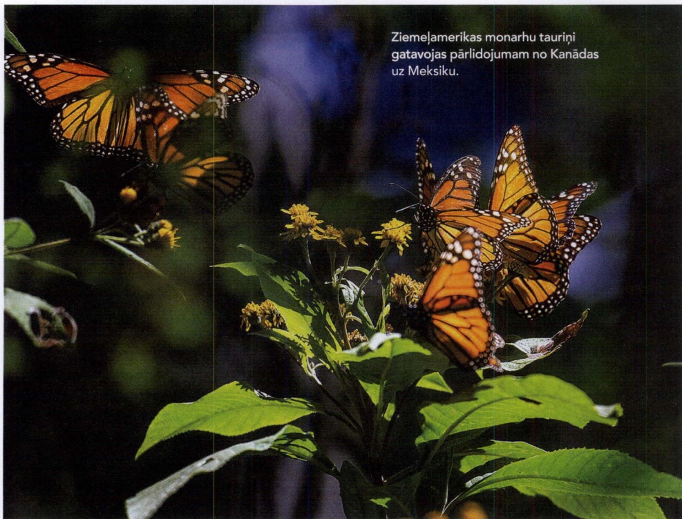
Ziemeļamerikas monarhu tauriņi gatavojas pārlidojumam no Kanādas uz Meksiku.

T aču 2018. gads atnesa visām Latvijas vietējā kapitāla bankām nepatīkamu pārsteigumu – Eiropas Centrālā banka un ASV Finanšu noziegumu apkarošanas tīkls ( FinCEN ) slēdza vienu no Latvijas lielākajām vietējā kapitāla komercbankām ABLV . Starptautiskie finanšu regulatori pastiprināja prasības NIL-ITF jomā, un daudzas Eiropas bankas, tostarp Latvijā strādājošās skandināvu bankas, bija spiestas maksāt par savām kļūdām milzīgus sodus. Trasta komercbanka un ABLV banka tika slēgtas. Tikmēr